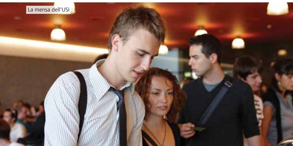
La mensa dell'USI

Inoltre nelle vicinanze dell'USI ci sono vari ristoranti, bar e take away a disposizione degli studenti.