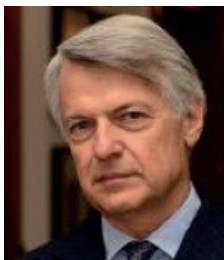
Ferruccio De Bortoli