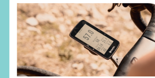
Accessori per biciclette

Su biketowork.ch trovi tutti i premi individuali e di squadra.