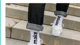
Abbigliamento e borse

Se utilizzi la bicicletta per almeno il 50% delle tue giornate lavorative, partecipi automaticamente all'estrazione dei premi.