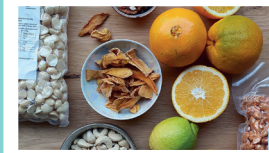
Cibo e bevande