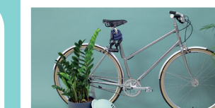
Biciclette e noleggio bici