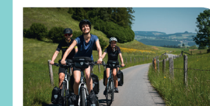
Viaggi ed escursioni