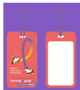
Etichetta per bagaglio: gadget distribuito ai partecipanti alle sessioni informative.

Oltre a questo materiale promozionale, il Servizio ha pubblicato, come ogni anno, la Study Abroad Guide , la guida ufficiale per l'organizzazione di un soggiorno di studio fuori sede, e il video ufficiale 5 ragioni per un'esperienza di studio all'estero è rimasto visibile sul sito. 10