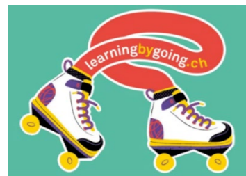
Sticker da pavimento, a indicare il percorso per raggiungere le sessioni informative e l'ufficio del Servizio.