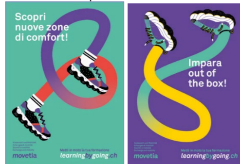
Poster A3 e cartoline A6, distribuiti sui Campus.