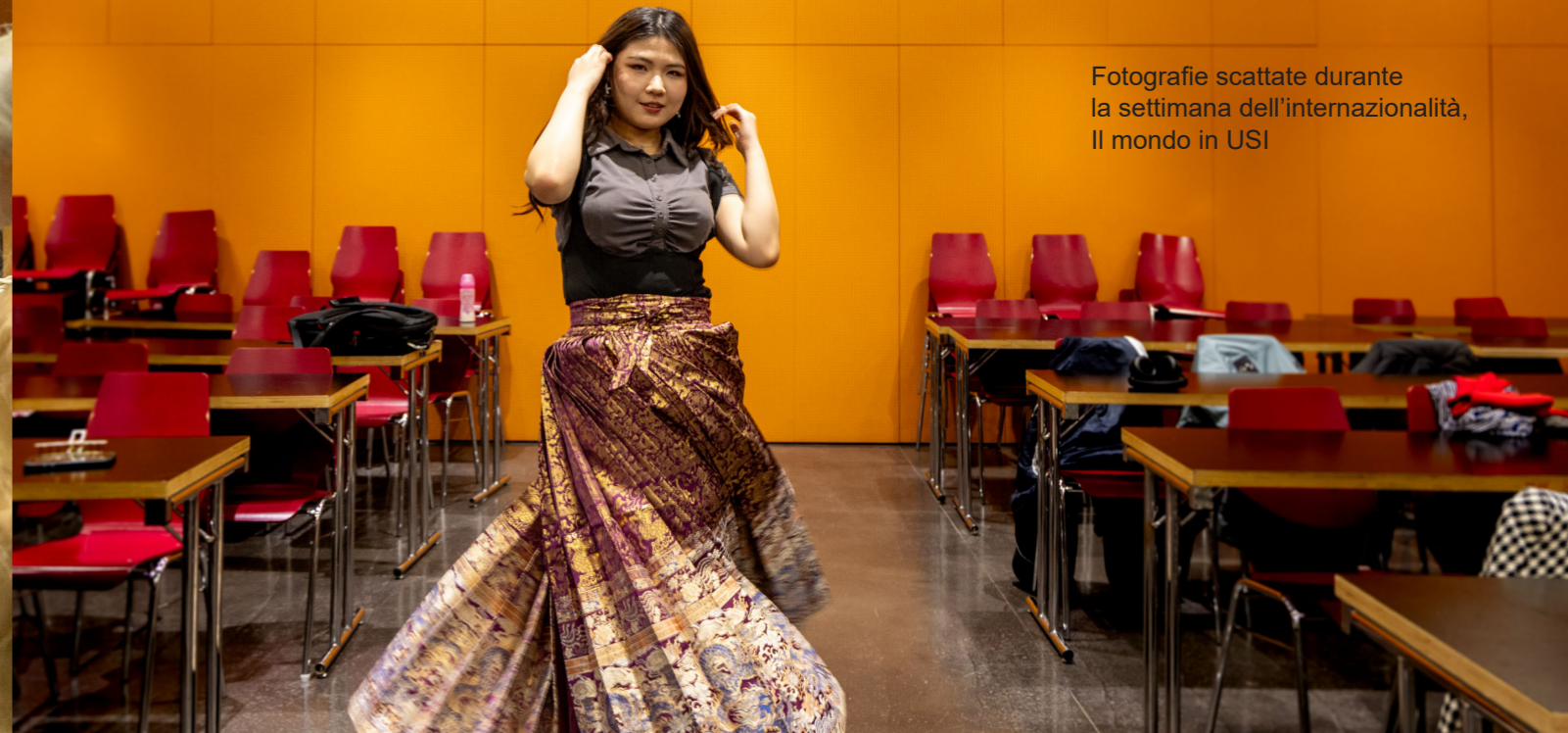
Fotografie scattate durante la settimana dell'internazionalità, Il mondo in USI